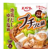
地鶏だし ゆず塩鍋