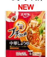
ホッと温 中華しょうゆ