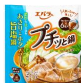
あさりとホタテの 旨塩鍋