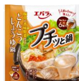
とんこつ しょうゆ鍋